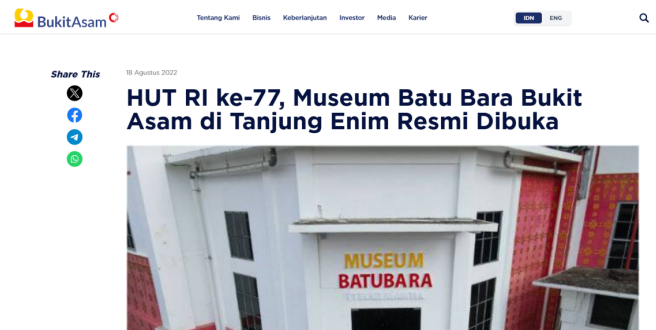
Gambar 4. Publikasi PTBA terkait Peresmian Museum Batu Bara

Secara operasional, terdapat diferensiasi fungsi antarplatform: Instagram menonjolkan pengalaman pengunjung ( human-centered storytelling ), TikTok bersifat visual-eksploratif, Facebook informatif, dan Payo Lur transaksional. Namun, diferensiasi ini belum diikuti integrasi naratif. Tidak terdapat kesinambungan cerita maupun mekanisme yang mengarahkan khalayak berpindah antarplatform sebagai bagian dari satu perjalanan naratif (Jenkins, 2008).