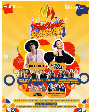
Gambar 3. Publikasi Festival Rakyat HUT ke-44 PTBA

Pada aspek simbol, elemen seperti alat berat, replika tambang, dan visual proses pertambangan merepresentasikan identitas industri. Akan tetapi, simbol tersebut lebih banyak berfungsi sebagai elemen visual daripada pembawa makna naratif. Hal ini menunjukkan reduksi fungsi simbol, padahal dalam storytelling simbol berperan menyederhanakan dan memperkuat makna brand (Fog et al., 2010).