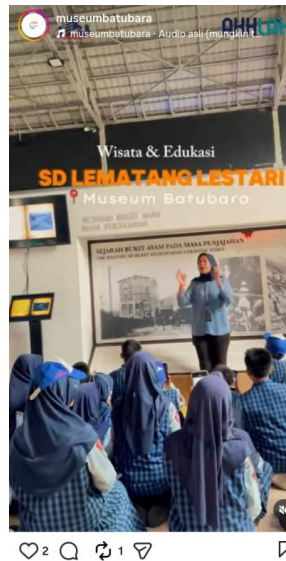
Gambar 1. Aktivitas Edukasi Pengunjung di Museum Batu Bara

terfragmentasi, sehingga melemahkan kekuatan pesan destinasi (Hidayat & Febriyanti, 2024).