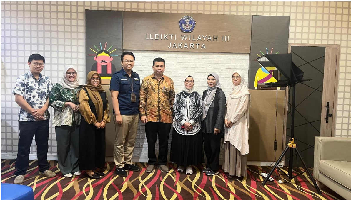
1. Konsultasi SPMI dengan LLDIKTI Wilayah III (Kamis, 18 Desember 2025)