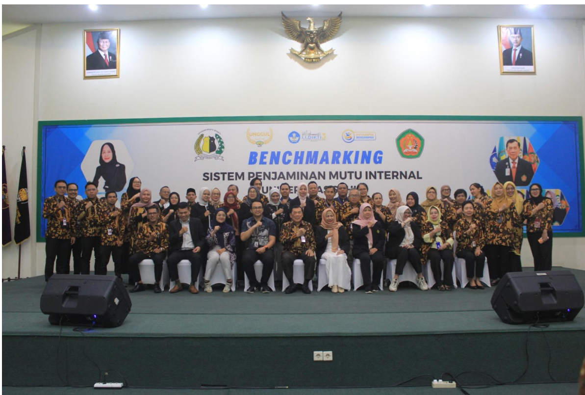
2. Benchmarking SPMI dengan Universitas Bhayangkara Jakarta Raya (Ubhara Jaya) pada Selasa, 13 Januari 2026