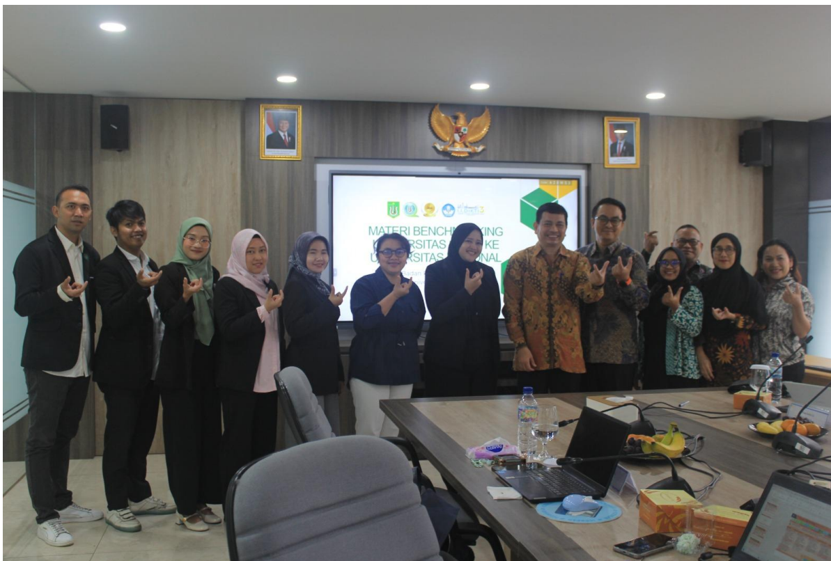
4. Benchmarking SPMI dengan Universitas Nasional (UNAS) pada Sabtu, 07 Februari 2026