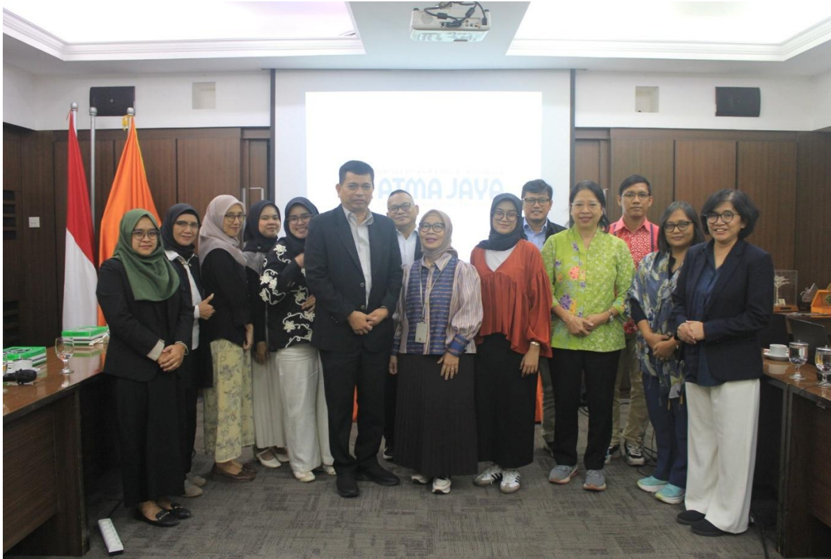
3. Benchmarking SPMI dengan Universitas Kristen Indonesia Atma Jaya (Unika Atma Jaya) pada Selasa, 03 Februari 2026